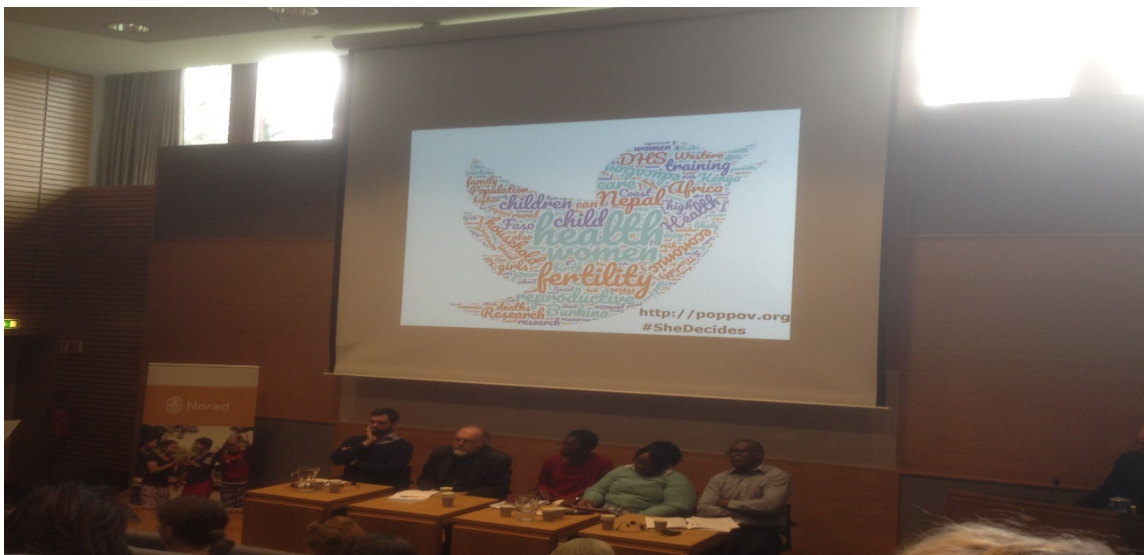
Fra paneldiskusjonen

Dagen ble avsluttet med en paneldiskusjon mellom alle forskerne, som ble ledet av Torunn Tryggestad, seniorforsker og direktør ved PRIO på Kjønn, Fred og Sikkerhet. Hennes hovedbudskap var: FLERE KVINNER MÅ ENGASJERES! Vi ble også minnet om at PRIO, Norad og UD samarbeider. FNs sikkerhetsresolusjon 1325 er ikke en separat aktivitet, men inngår som en del i alle temaer/agendaer de jobber med ifm med FNs bærekraftsmål.