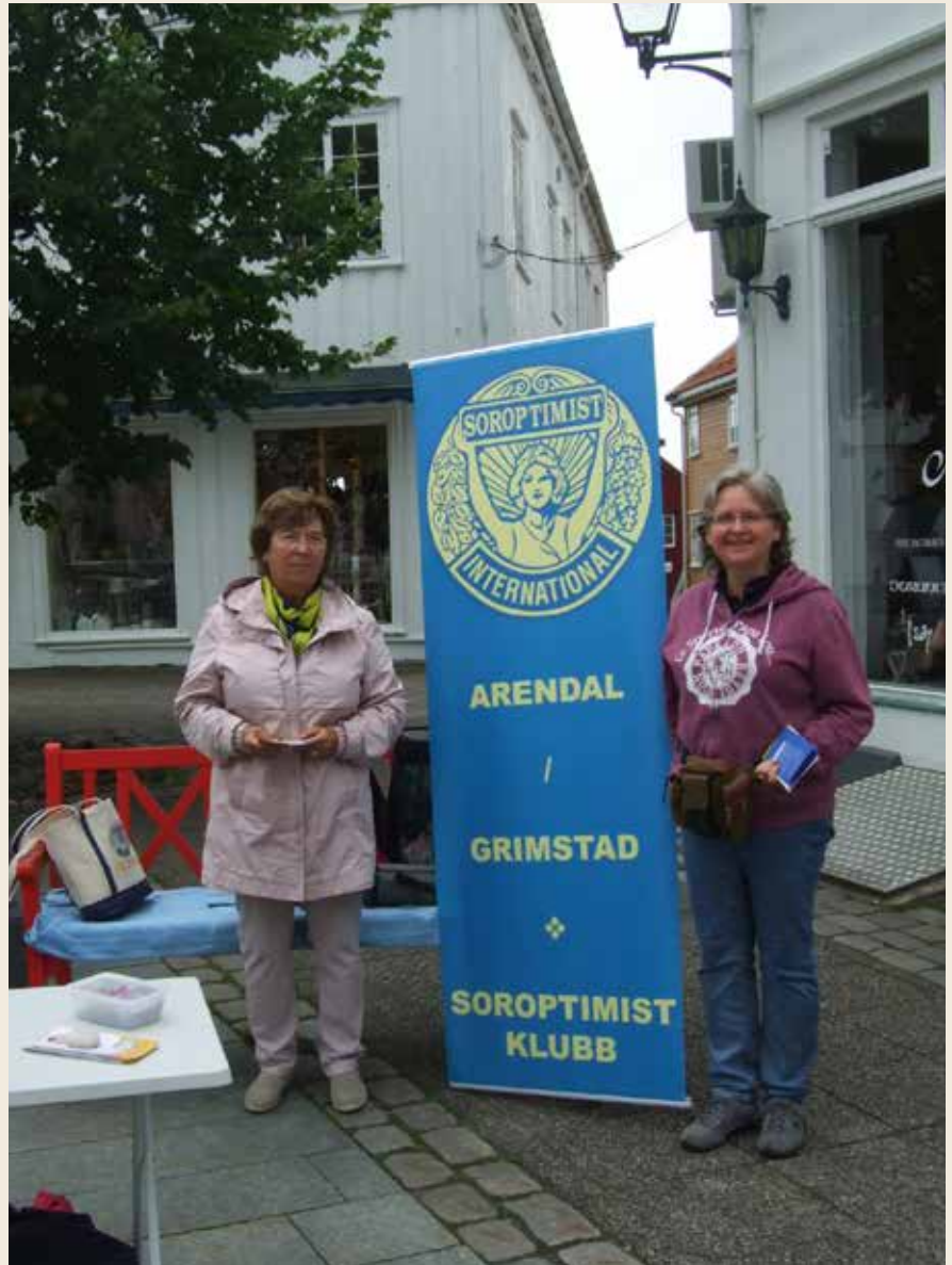
På stand på Bietorvet sept 2016.