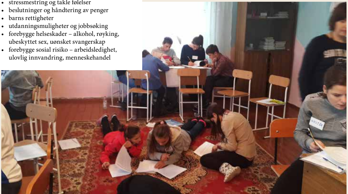
Stort engasjement i gruppearbeidet om livsmestring.

I årene 2006 til 2014 fikk flere enn 250 ungdommer mellom 13 og 16 år ved fire internatskoler i Moldova opplæring i livsmestring. Tretti unge mellom 16 og 19 år fikk også videreutdanning til et yrke ved hjelp av midler til livsopphold, et sted å bo og oppfølging av sosialarbeidere fra CRIC. Evaluering av prosjektene viste at disse ungdommene klarte seg bedre både sosialt og profesjonelt enn mange andre når de kom ut i samfunnet på egen hånd.