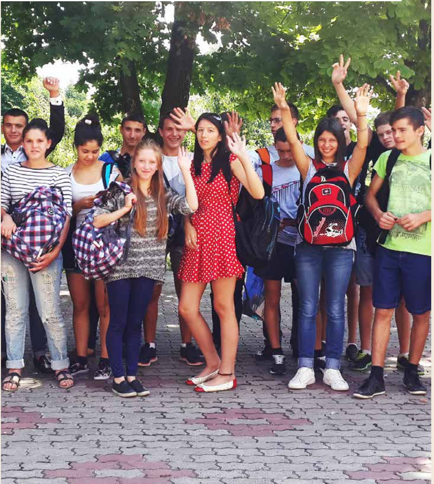
Adjø - og takk for nå! Bildet er tatt i juli 2016.