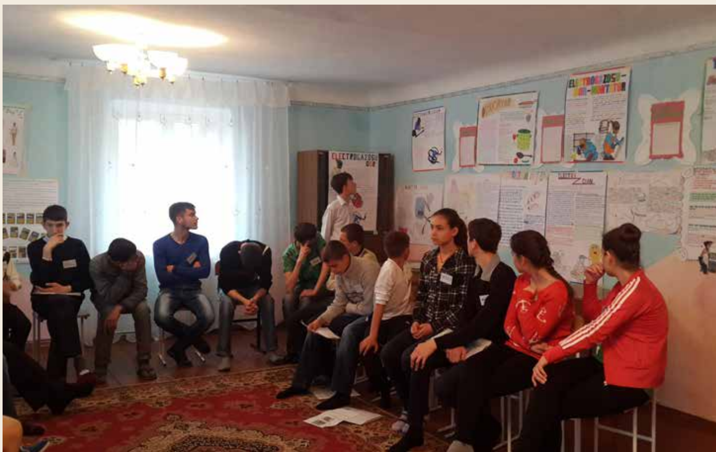
Fra opplæring i livsmestring og karriereveiledning. Opplæringen blir gjennomført på to helgesamlinger, og ungdommene jobber i grupper med forskjellige aktuelle temaer.

Med bakgrunn i de gode erfaringene inngikk SI Norgesunionen for skoleåret 2014/2015 en avtale med CRIC om prosjektet «Educating youth for the future», der 110 ungdommer i alderen 13 til 16 år fra tre internat-skoler fikk opplæring i livsmestring og karriereveiledning med tanke på videre yrkesutdanning. Prosjektet fortsatte i 2015/2016 der 100 ungdommer ved de samme internat-skolene også fikk opplæring i livsmestring og karriereveiledning. Opplæringen i livsmestring ble gjennomført på to helgesamlinger i løpet av skoleåret.