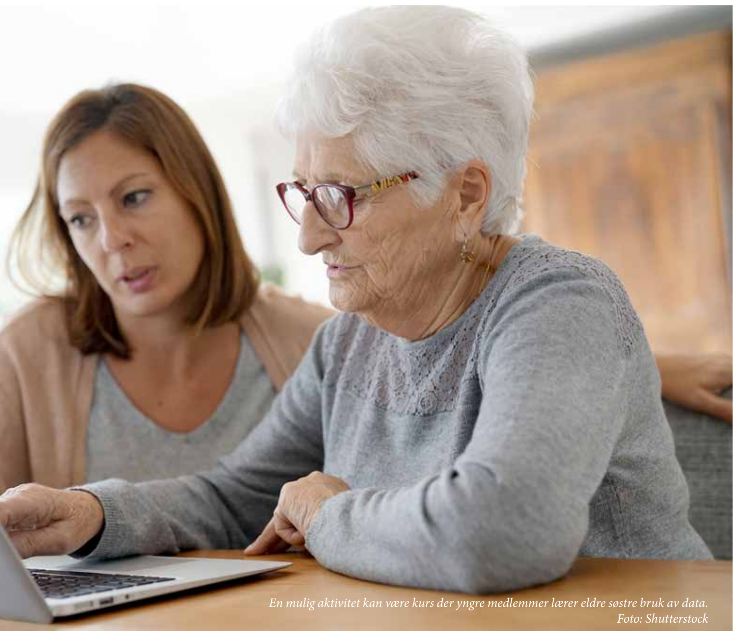
En mulig aktivitet kan være kurs der yngre medlemmer lærer eldre søstre bruk av data.