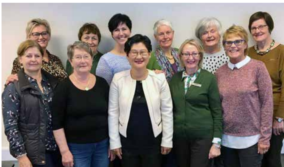
Distriktskontaktene og ekstensjonskomiteen samlet i forbindelse med et møte.

For å oppnå en felles forståelse for mål og arbeid, jobber ekstensjonskomiteen og distriktskontaktene i team. Til dette brukes både fysiske og nettbaserte møter.