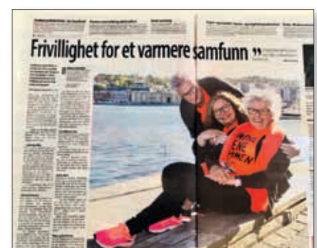
MEDIA OPPSLAG: Arbeidet med TV-aksjonen ga klubben en god del oppmerksomhet i lokale media.