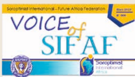
AFRIKA: Vi nå får en ny føderasjon i Afrika. Bildet er fra medlemsbladet, Voice of SIF AF.

Av Kirsti Guttormsen, styremedlem, Soroptimist International