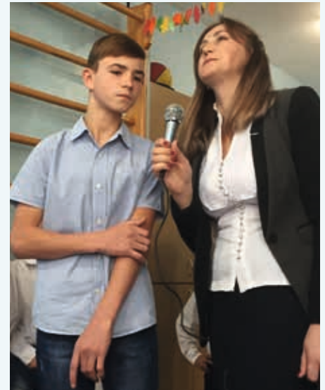
15 ÅR OG ALENE: Da gutten sang om liv sitt, gjorde det et sterkt inntrykk på besøkende fra Norge.