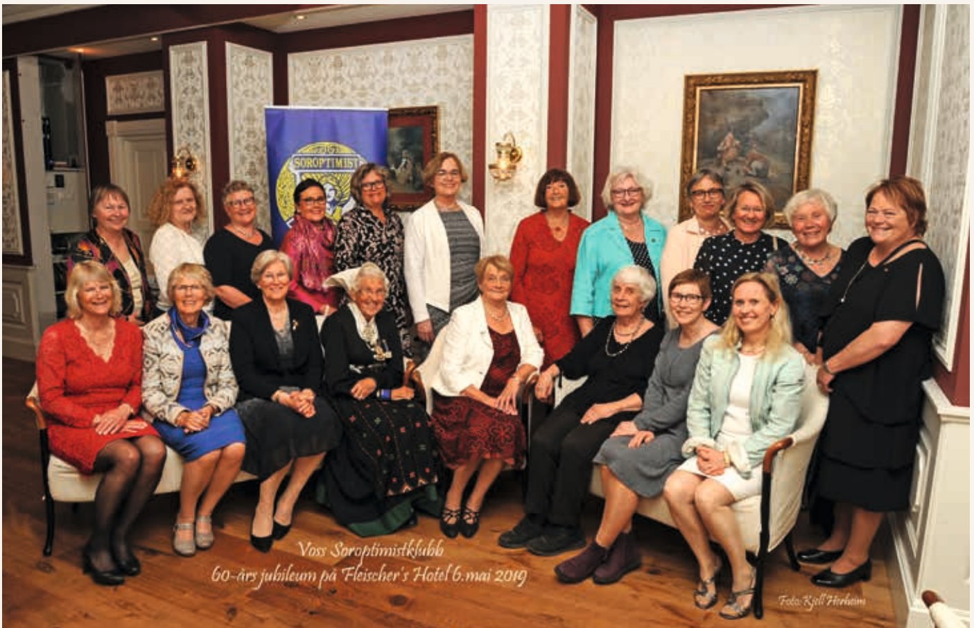
Voss Soroptimistklubb 60-års jubileum på Fleischer's Hotel 6.mai 2019