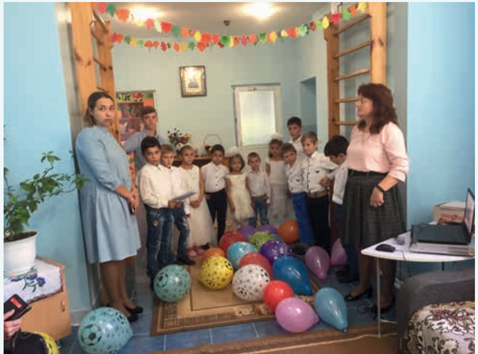
BARNEHJEM: SI Stefan Voda støtte dette barnehjemet.

«Vi fikk møte noen av de 13 voksne damene som hadde deltatt, og hørte at prosjektet hadde gitt positive effekter for flere eldre,» sier Berit.