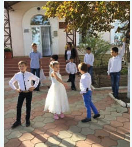
BARNEHJEMMET: Området rundt barnehjemmet var barnevennlig.