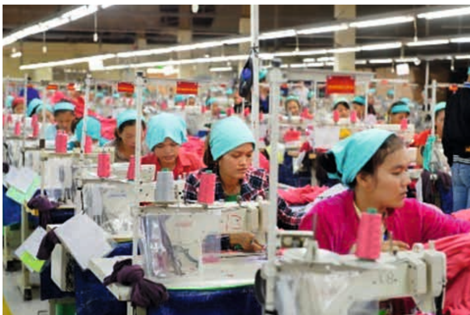
KAMBODSJA: Nesten 85% av de 650.000 arbeidere i tekstilindustrien i Kambodsja er kvinner.

Likestilling og kvinners rettigheter er et gjennomgående tema i FNs bærekraftsmål som skal realiseres inne 2030. FNs bærekraftsmål nummer 5 skal sørge for full likestilling mellom kjønnene, styrke kvinners stilling og stoppe diskriminering av kvinner.