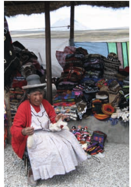
EGEN INNTEKT: Det er mange måter å livnære seg på – fra et marked i Laos og fra fjellene i Peru.