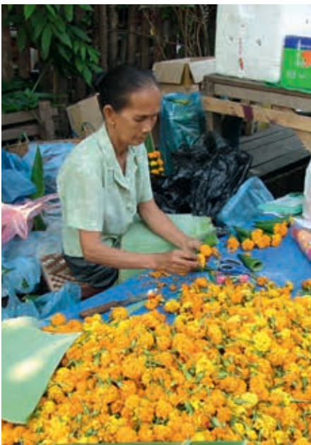
ARBEID: Fra blomstermarkedet i Luang Prabang, Laos.

kvinner ikke får delta i arbeidsmarkedet, mister samfunnet både arbeidskraft, skatteinntekter og verdifull kjøpekraft. Likestilling er derfor ikke bare en kamp for kvinners rettigheter, det gir også en stor samfunnsøkonomisk gevinst.