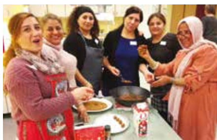
Flerkulturell gruppe.