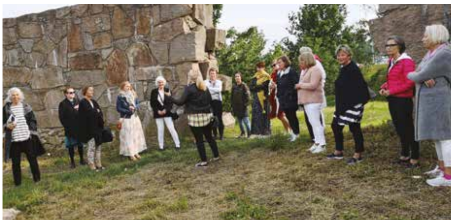
Historisk tur på Isegran i Fredrikstad.