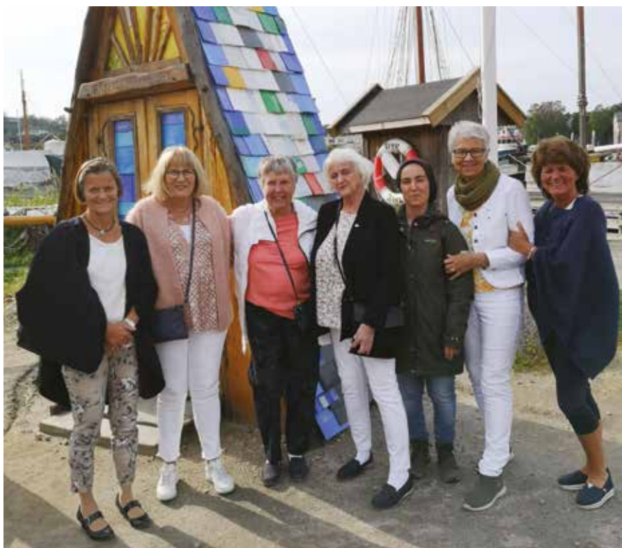
Håpets katedral Isegran i Fredrikstad.

I 2019 var klubben vår 30 år og fortsatt ung. Medlemmene våre er noe eldre. Vi ønsker oss nye yngre medlemmer.