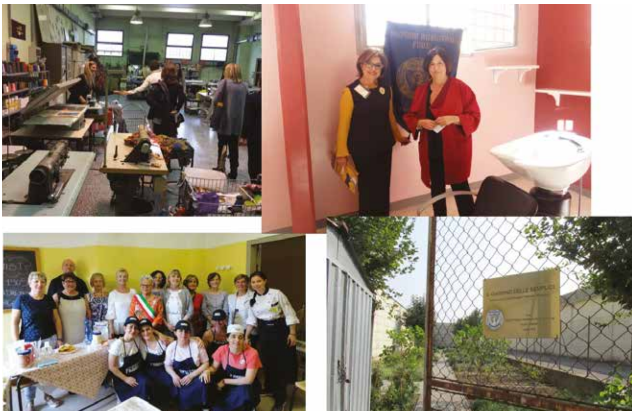
Bilder fra SI Sostiene, Italia. Donne@Lavoro SI Sostiene in Carcere.