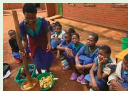
Forberedelser til bananmuffins.