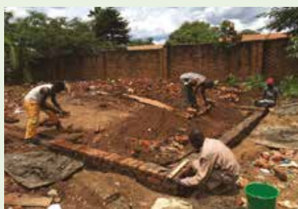
Bygging av klasserom for funksjons-hemmede.