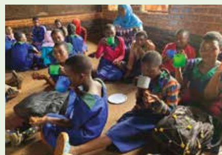
Jentene nyter saft og muffins.