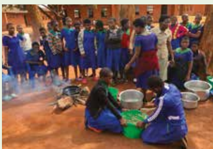
Deigen er ferdig!