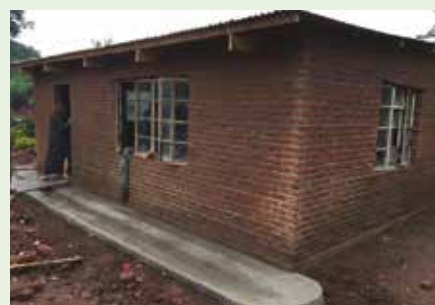
Etter fire uker er bygget ferdig med midler fra FOL.

og klasserom, kjøpt pulter og skolemateriell og reparert gamle bygg og utstyr. For å holde GPC i gang på alle skolene koster det ca. kr 60 000,- i året, ca. kr 30,- pr. jente. Det er også opprettet en gruppe med tre rektorer og to lærere i Lilongwe «Friends in Lilongwe» FIL, som administrerer arbeidet og har ansvaret for bankkontoen i Lilongwe.