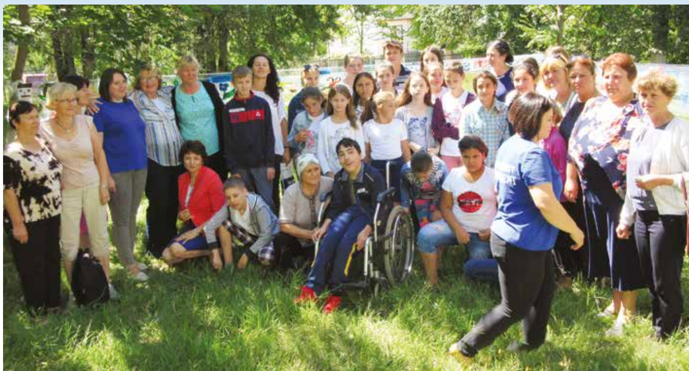
Her er vi alle samlet, sommerskolen i Nisporeni 2018.