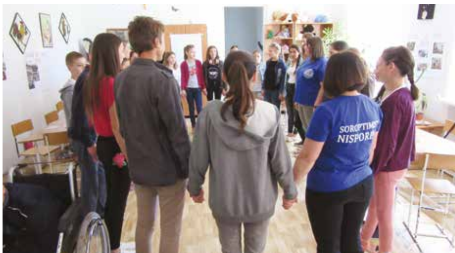
Elever og lærere, sommerskolen i Nisporeni 2018.