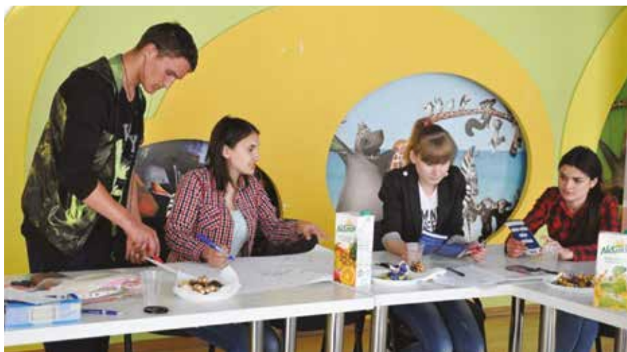
Elevene samarbeider.

SI Larvik - Stefan Voda SI Tønsberg - Chisinau SI Sandefjord - Edinet