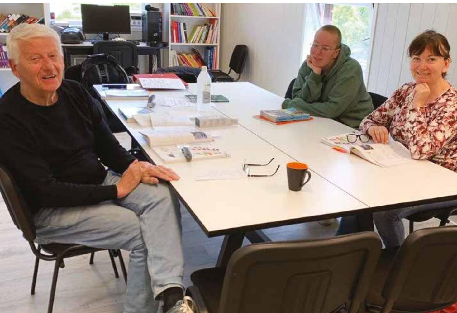
Lærer og elever i studiekлубben.