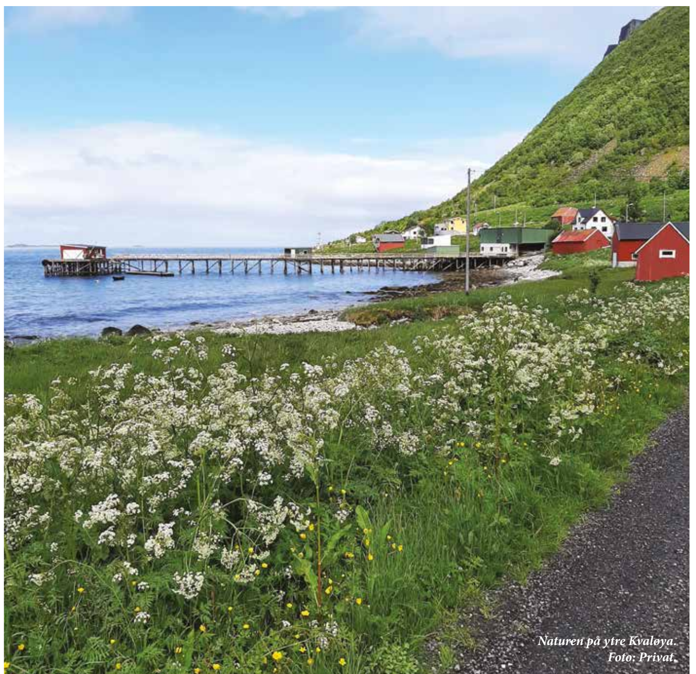
Naturen på ytre Kvaløya.

fra en enmanns-sjark. Både menn og kvinner fisker fra enmanns-sjarker.