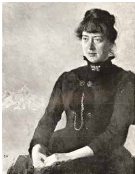
Cecilie Thoresen Krog.

D en første studenten ved et norsk universitet het Cecilie Thoresen. Hun ble immatrikulert på Universitetet i Kristiania i 1882. At Cecilie kom så langt, skyldes først og fremst hennes egen innsats, veien lå ikke åpen for en vitebegjærlig jente som ønsket seg utdanning. Da det ble anledning til å ta middelskoleeksamen, avla Cecilie eksamen allerede året etter. Men Cecilie hadde ambisjoner – hun ville ta eksamen artium. Selve eksamen foregikk på universitet, og der hadde ikke kvinner adgang. Cecilie hadde en far som støttet hennes ambisjoner, han skrev brev til Kirkedepartementet der han ba om at hans datter fikk ta sin eksamen artium. Avslaget kom på julaften 1880. Cecilie ga ikke opp, hun tok kontakt med kirkeministeren. Hun oppfattet ham som positivt innstilt, han ville selvfølgelig hjelpe lille frøken Thoresen, og han ga inntrykk av at han ville fremme en kongelig proposisjon. I stedet sendte han saken til Universitetet som svarte kontant: «Adgangen til å underkaste seg Universitets Examina skal være indskrenket til Mænd.»