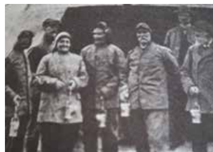
Årsberetning for den kvindelige fabrikkinspektør 1916, s.125

Betzy Kjelsberg hadde tett kontakt med det politiske miljøet, som flere av de tidlige kvinnesakskvinnene. De brukte aktivt de påvirkningsmulighetene de hadde gjennom sine nettverk. Flere av dem, blant annet Betzy Kjelsberg, ble selv aktive i politikken. Det var mange som hadde forventet at Kjelsberg ville komme til å bli sosialminister