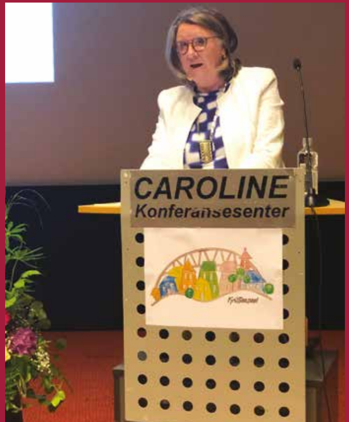
Hovedforedragsholder SIE presidenten.