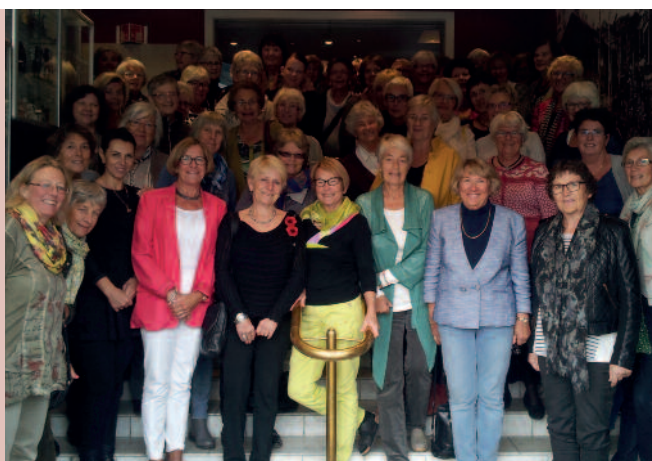
Deltakere på Distriktsmøte Midt-Norge.

Lørdag 20. september arrangerte Røros Soroptimistklubb Distriktsmøte Midt-Norge. Medlemmer fra soroptimistklubber i Levanger, Steinkjer, Trondheim, Trondheim syd og Røros var samlet, totalt 54 deltakere. AV HRISTINA ELVEN OG ANNE MARGRETHE WESSEL