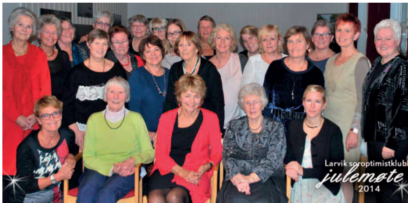
Bildet av strålende Larvik-soroptimister på jule-/jubileumsmøtet desember 2014.