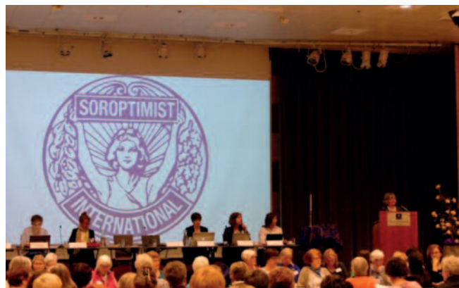
R-L møte i Stavanger.

I bakgrunnen kunne vi lytte til afrikansk musikk. ■