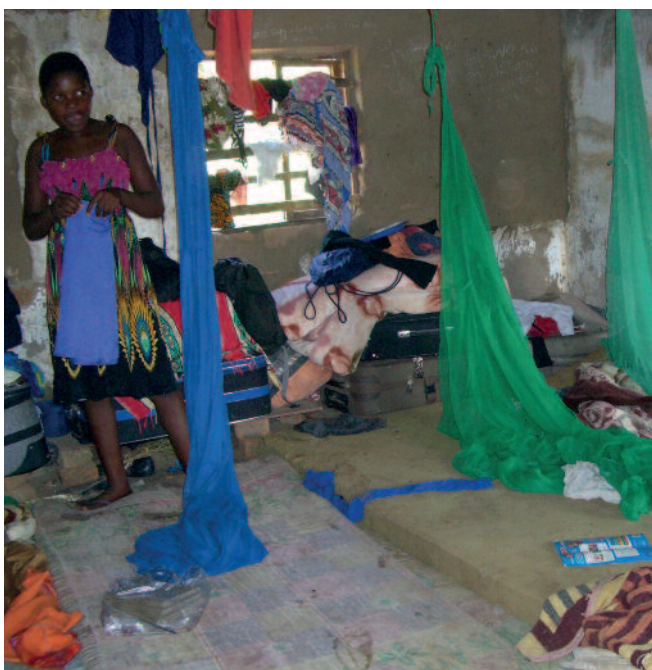
Her bor de.

Til tross for mange problemer er det lyspunkter. Det er økt forståelse for at hvert skoleår befolkninga får, har betydning