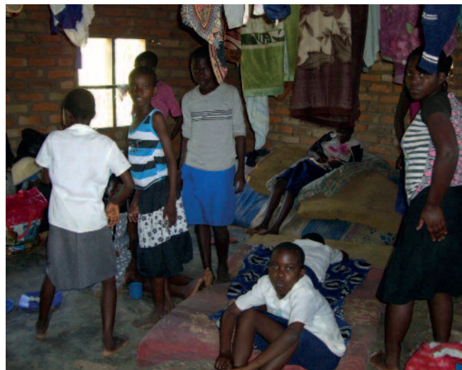
Her bor de.