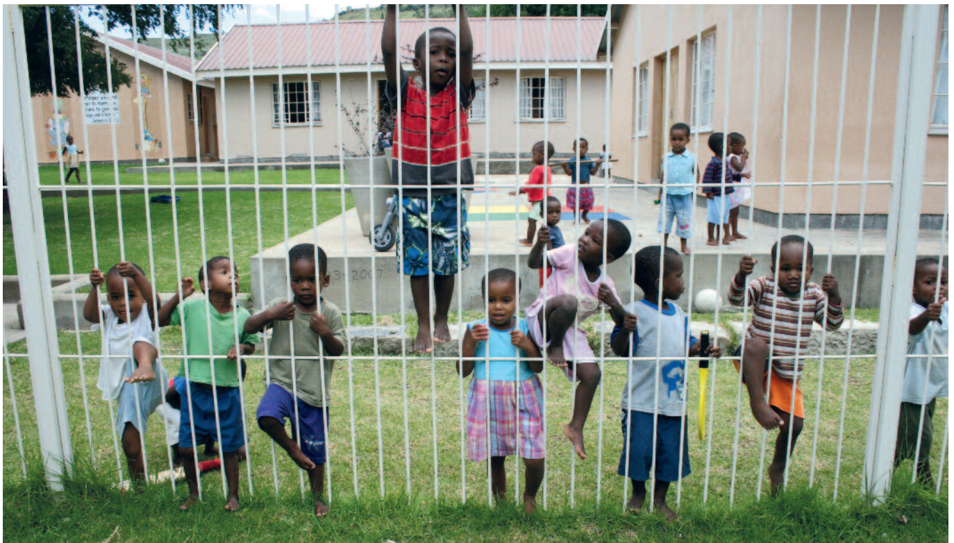
Velkomst ved Cross Road Childrens's Home.