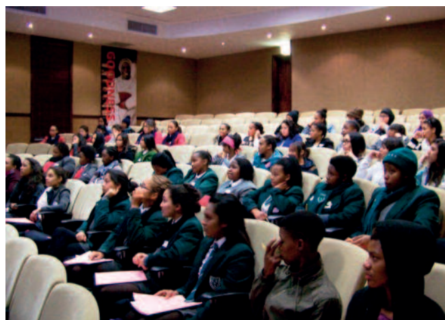
Jenter på Future Seminar – «The Day».

fra skoler i Cape Town som alle går i 11. klasse (16–17 år gamle) som betyr at de har ett år igjen før endt skolegang. Prosjektet er sponset av en av de store dagligvarekjedene, PicknPay. Programmet fokuserer på selvutvikling og omfatter emner som «Dare to Dream», «Self Defence – why I shall still be alive when I reach twenty one», «Dressing for Success», «My Sexuality» og «The Network and Me – using social media». De har også en Career Faire (utdannings og yrkesmesse) hvor jentene får informasjon om ulike yrker og steder hvor de kan studere.