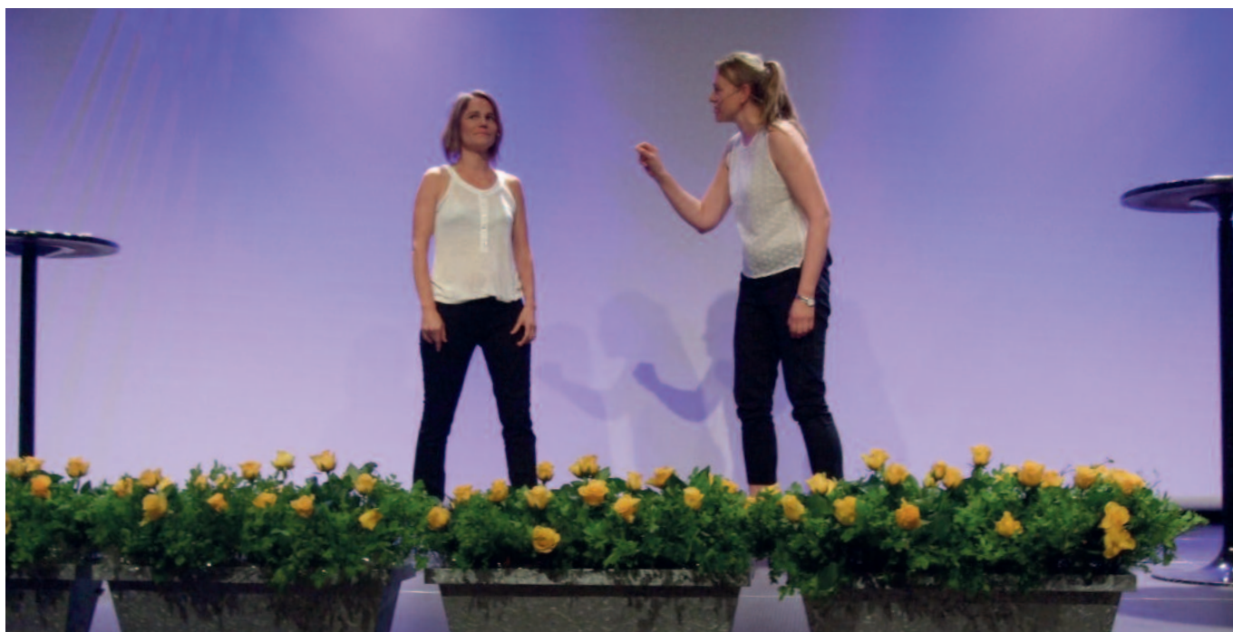
Smakebit av forestillingen Valgt det ... ved landsmøtet i Sandefjord mai 2016.