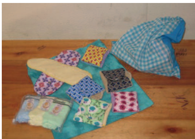
Bukser og bind.